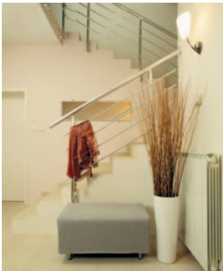
Входно антре Entrance hall

Private homes are, in my opinion, places which, above all, ensure comfort and convenience. Yet, a home also provides some personal space which bears the salient features and taste of its