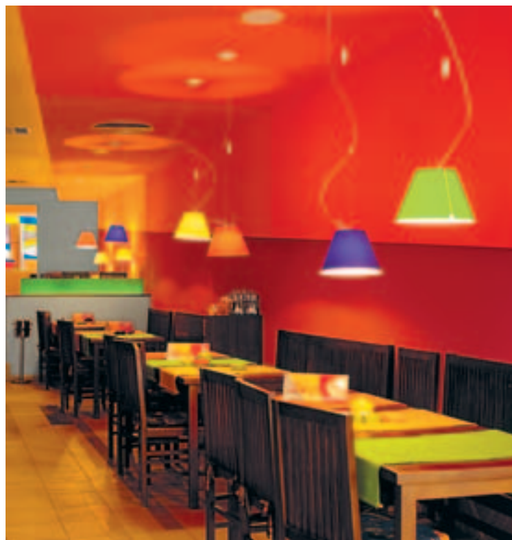
Интериорът на Del Mondo Del Mondo's interior

inhabitants. Grasping how people envision their home is the starting point. It is advisable that the colours and materials used in private housing be moderate. In my view, a home should be furnished in light, soft and delicate colours so as to make it cosy and give it specific accents of various character - accessories, furniture, paintings.