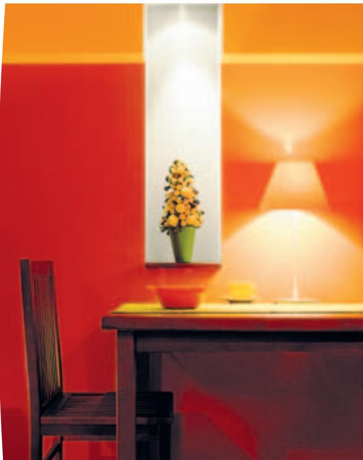
Интериорът на Del Mondo Del Mondo's interior

Проектът за сградата и неговите интериори следва да бъдат едно цяло. Само така този, който проектира пространствата може да заложи в тях специфични елементи от интериора. У нас тази практика до момента беше рядкост, но все повече инвеститорите разбират необходимостта да поръчват комплексни проекти.