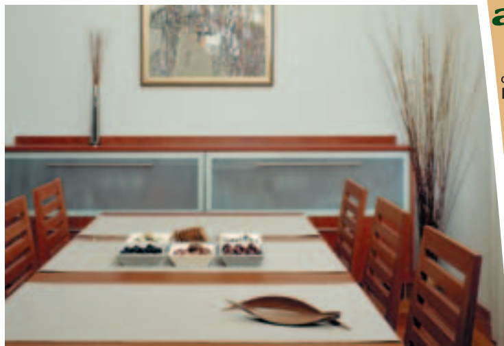
Трапезария Dinnig room

При обществения интериор свободата е по-голяма. Решенията биха могли да са по-агресивни като цвят и форма, но винаги е добре да стъпват на предварителен анализ на съществуващото пространство, което ще бъде обработено. Друг съществен фактор за успешния краен резултат е предварително да е изяснено какво се цели като крайно внушение за посетителя.